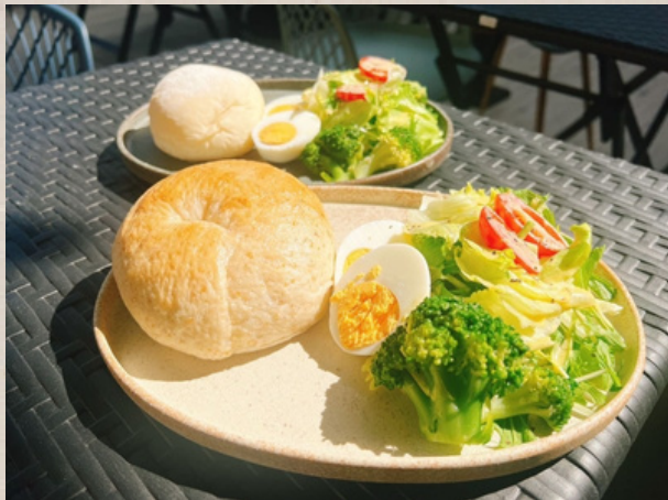
モーニングセット