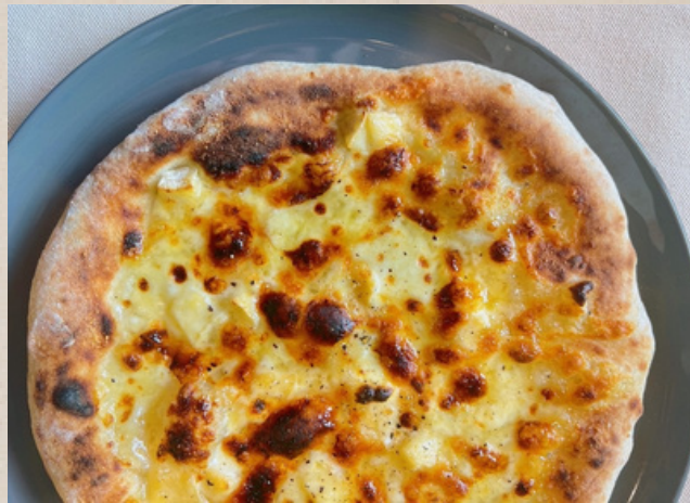
クアトロフォルマッジオ

(モッツアレラ・ナチュラルチーズ・クリームチーズ ・パルメジャーノレッジャーノ)