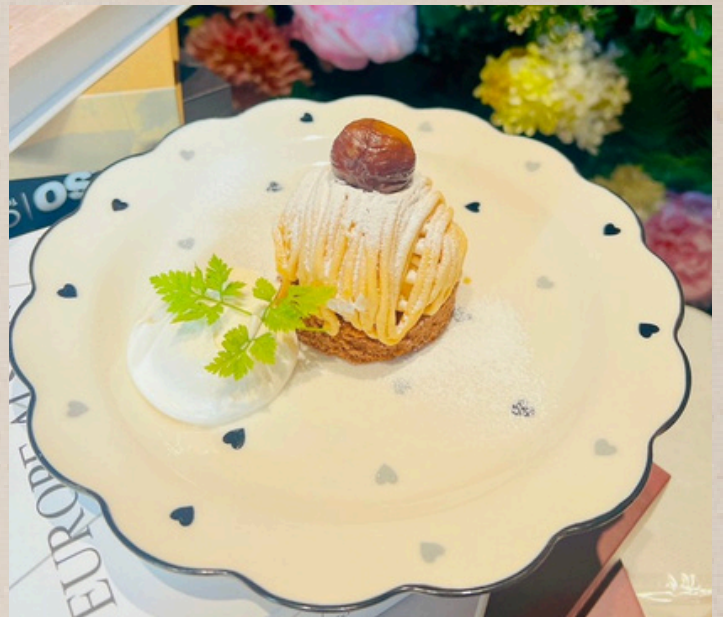
季節のデザート ¥600 ※スタッフまでお尋ねください