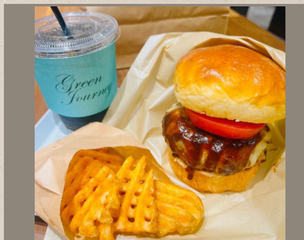
クラフトチーズバーガー ポテト・ドリンク付き