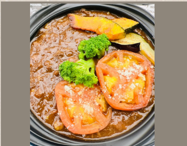
ビーフカレー (ライス別) ¥1300