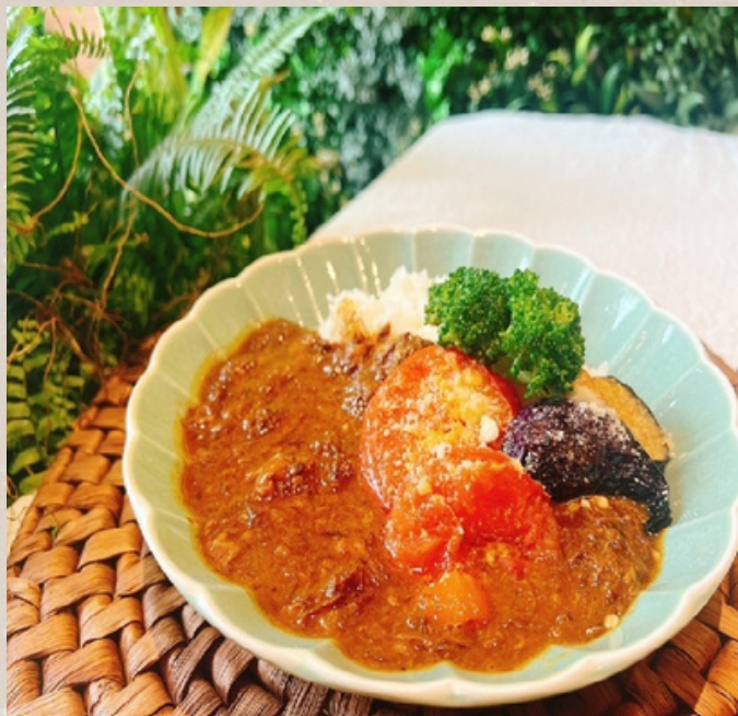
和牛100%ビーフカレー 彩り野菜