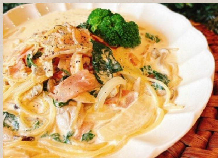
ブロッコリーとシーフードの クリームパスタ