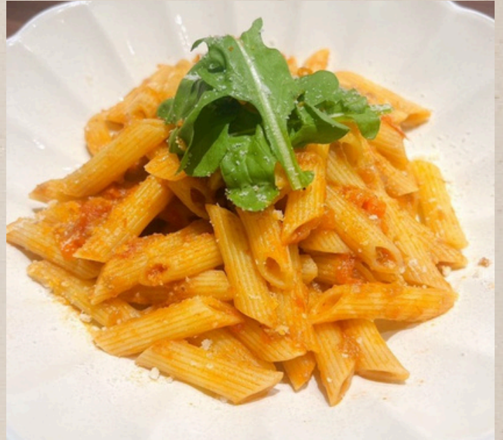
ボロネーゼペンネ