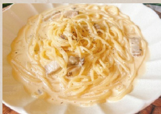
燻製ベーコンのカルボナーラ