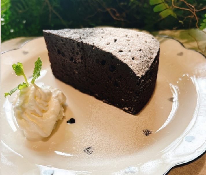
ガトーショコラ ¥950 (生クリームとコーヒークリーム)