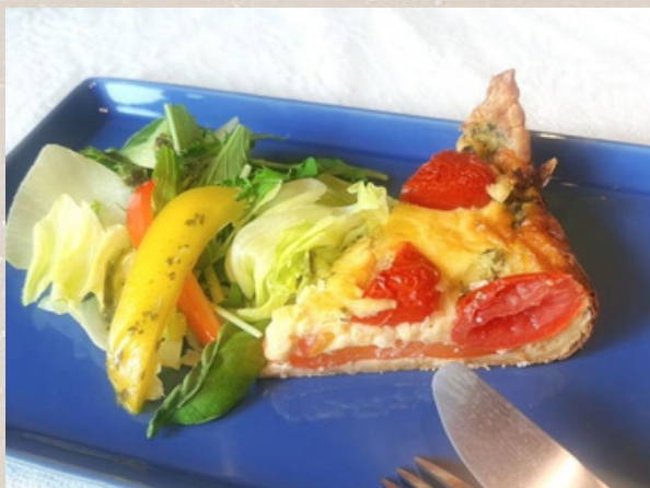
モーニングキッシュプレートセット