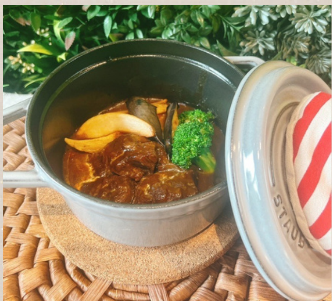
ほろほろ肉のビーフシチュー パン付き