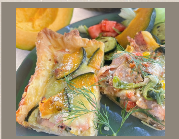
季節野菜のキッシュ ¥550