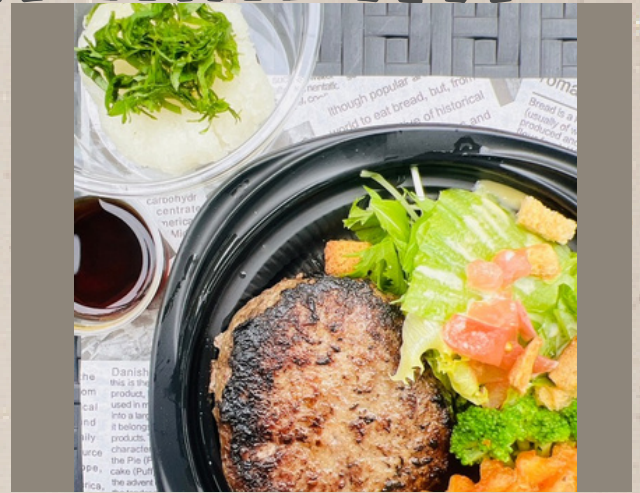
和風ハンバーグ (ライス別) ¥1000