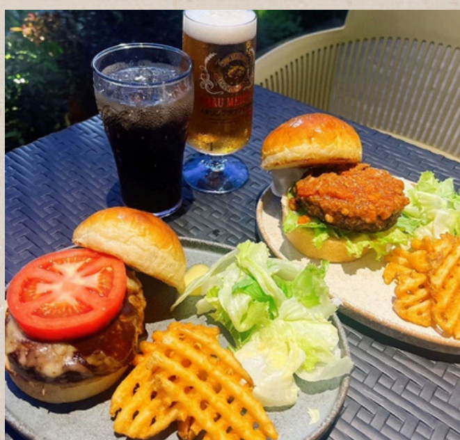
クラフトバーガー