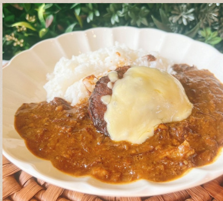
和牛100%ビーフカレー チーズハハンバーグ