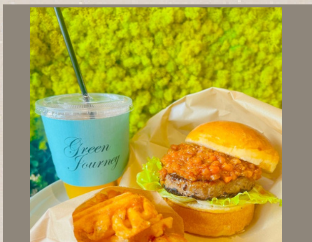
クラフトバーガー ポテト・ドリンク付き