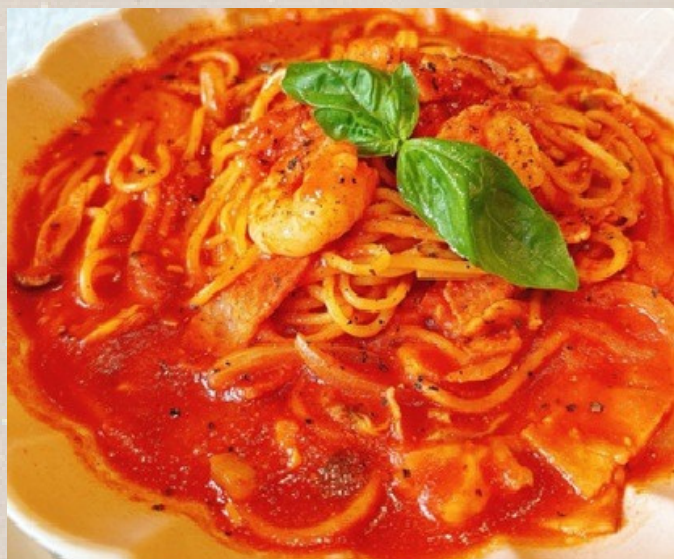
えびとあさりとベーコンのトマト スープパスタ 🌶️🌶️🌶️