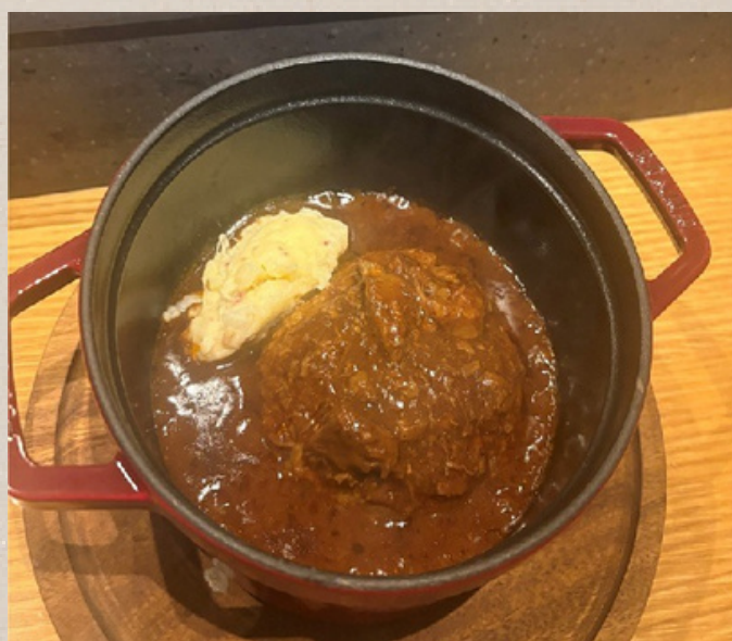
和牛 煮込みハンバーグ ライス付き