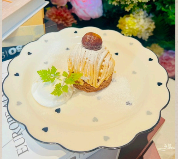
季節のデザート ¥900 ※スタッフまでお尋ねください