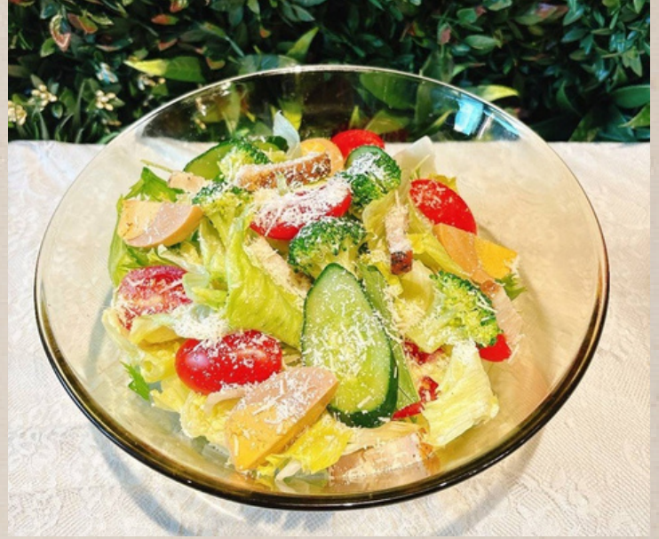
燻製たまごのシーザーサラダ ¥1300