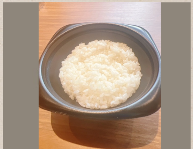
クラフトチーズバーガー ポテト・ドリンク付き ¥1400