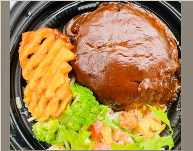
デミグラスハンバーグ (ライス別) ¥1000