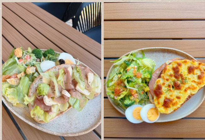
カンパーニュサンドセット