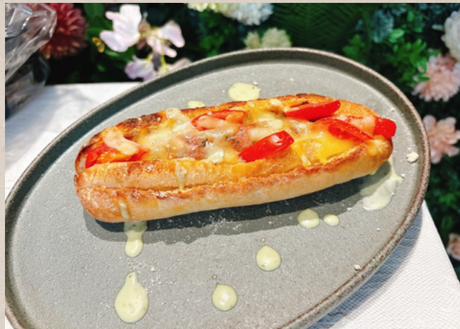
ソーセージサンドセット