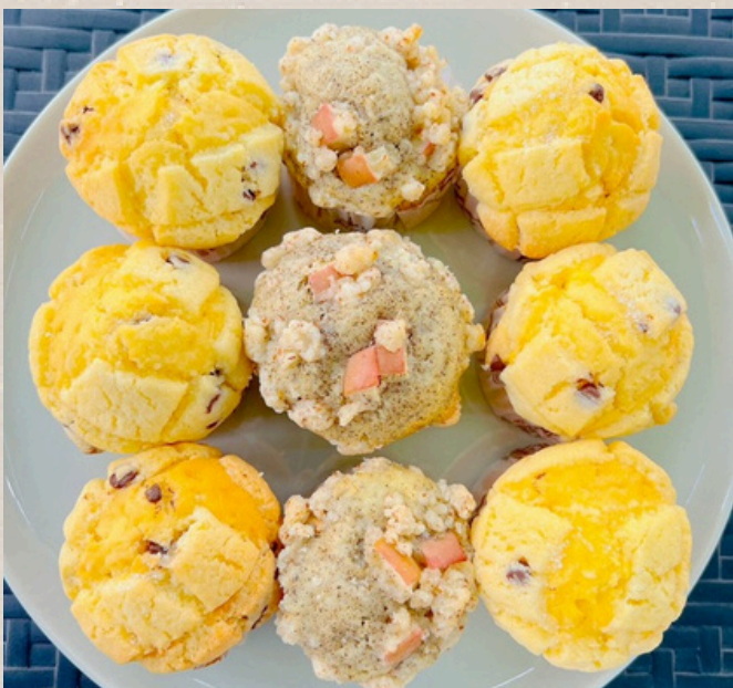
本日のデザート ¥800 ※スタッフまでお尋ねください