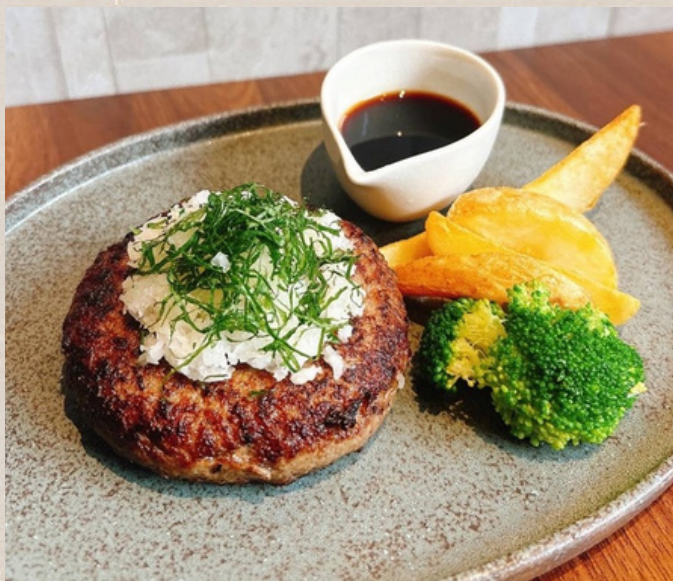
和牛100% ハンバーグ ライス付き (和風・デミグラスからお選びください)

(モッツアレラ・ナチュラルチーズ・クリーム チーズ・パルミジャーノレッジャーノ) ¥1400