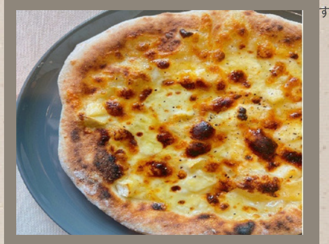
クアトロフォルマッジオ