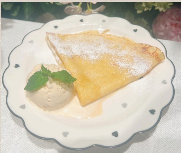
シュガーバタークレープ (塩キャラメルアイス)