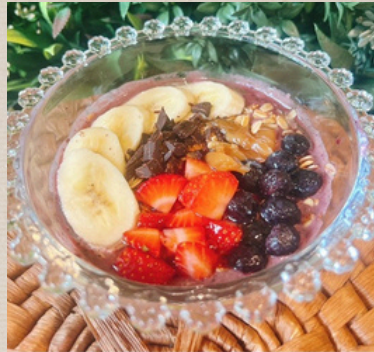
アサイーボール S ¥1000 アサイーボール M ¥2000