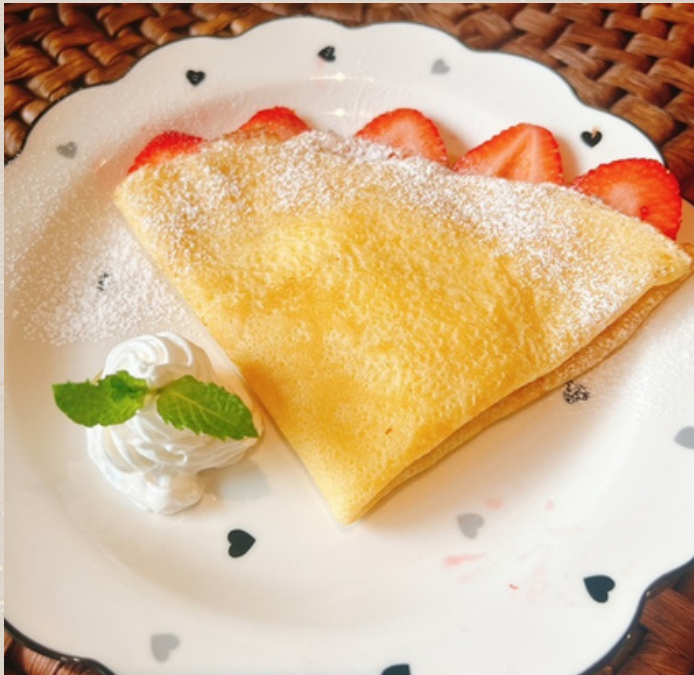
いちごのクレープ