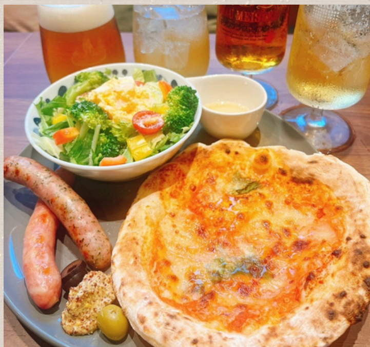
ランチ アルコール プレート