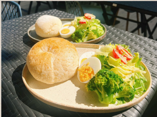
モーニングセット