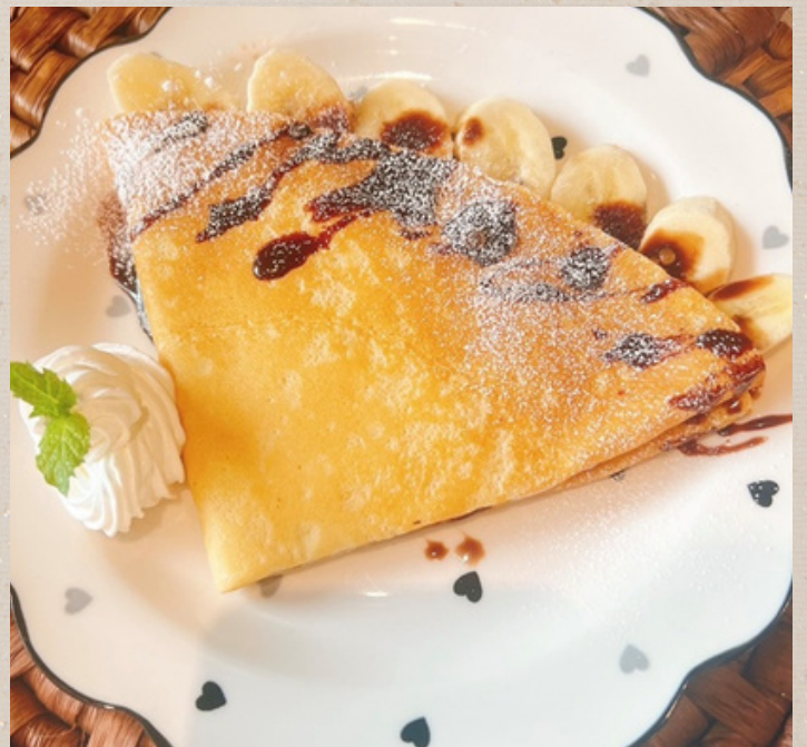
チョコバナナクレープ