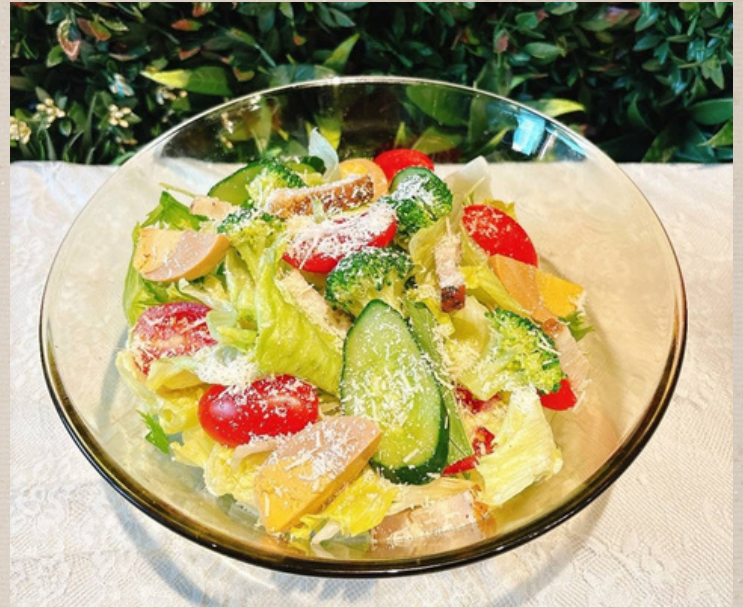
燻製たまごのシーザーサラダ ¥1300