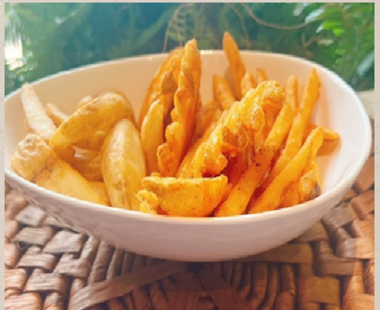
ポテト3種 盛り合わせ ¥800