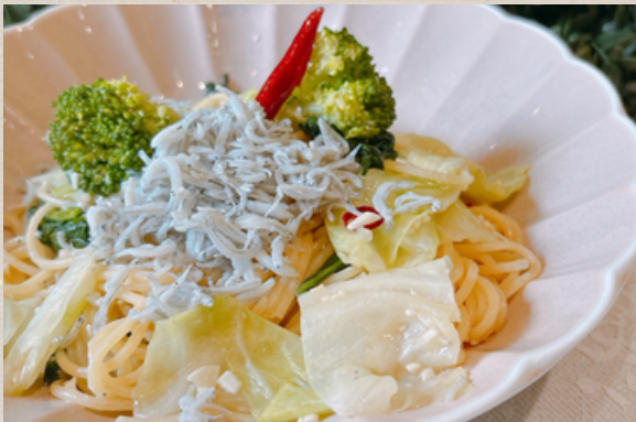
しらすとキャベツのペペロンチーノ

+300円 サラダ小鉢・+300円 アイスクリーム・+350円 コーヒーゼリー・+500円 ミニシュガークレープ ドリンクはタンブラー交換制になります。空になりましたら呼び出しボタンをご利用ください サラダ小鉢を追加の際は、和風・シーザー・とうもろこしからドレッシングをお選びください