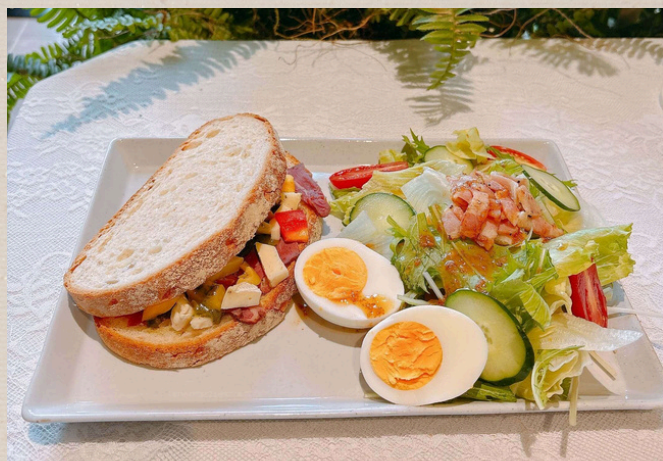
パストラミとカマンベールサンドセット