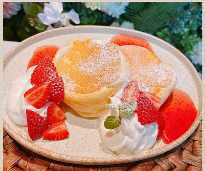
いちごのパンケーキ (2枚) ¥1750