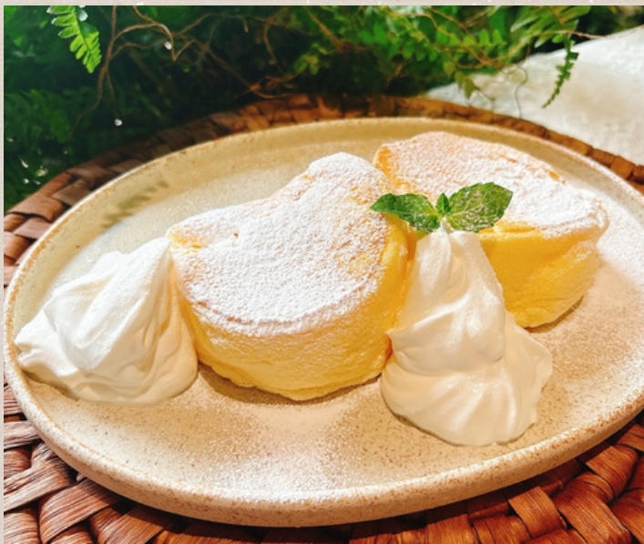
パンケーキ (生クリームとコーヒークリーム)