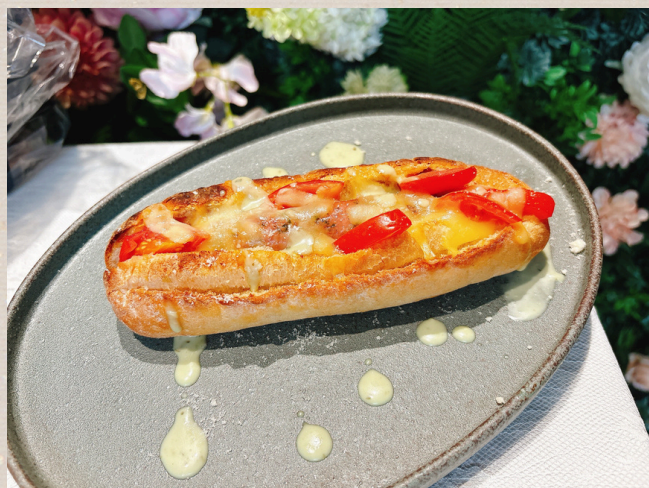
ソーセージサンドセット