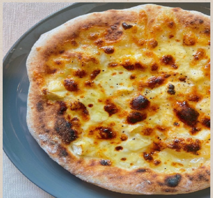
クアトロフォルマッジオ (モッツアレラ・ナチュラルチーズ・クリーム チーズ・パルミジャーノレッジャーノ) ¥1400