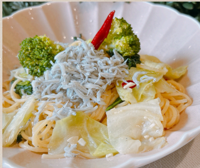
しらすとキャベツのペペロンチーノ ¥1200