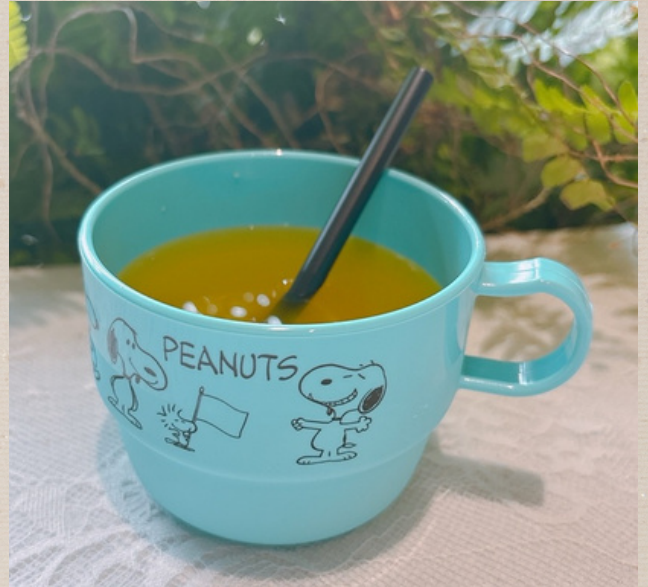
キッズドリンク飲み放題