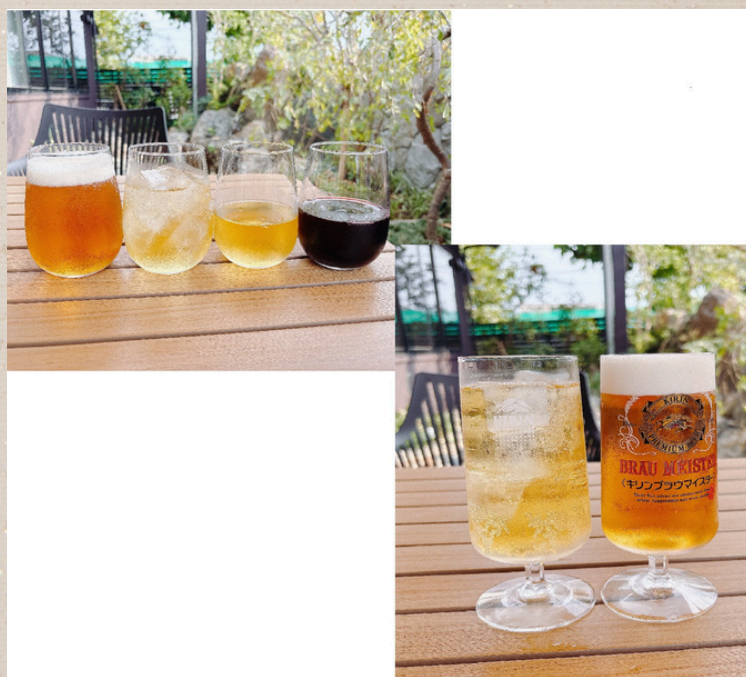
ランチ アルコール 小