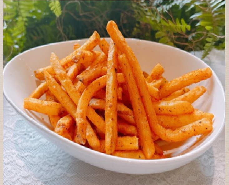
ケイジャンスパイスポテト