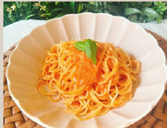
蟹のトマトクリームパスタ