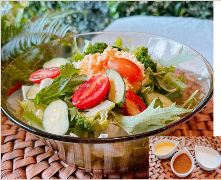
グリーンサラダ 和風・シーザー・とうもろこしから ドレッシングをお選びください) ¥1000