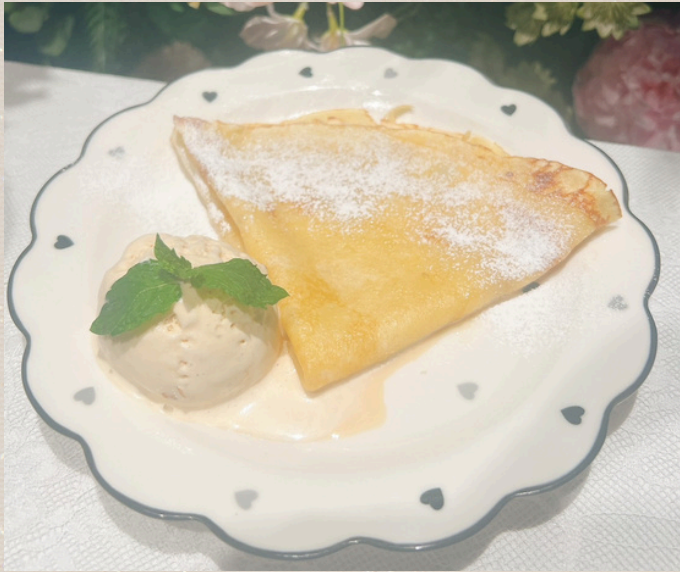
シュガーバタークレープ ¥900 (塩キャラメルアイス)