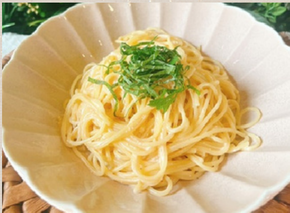
たらこスパゲティ