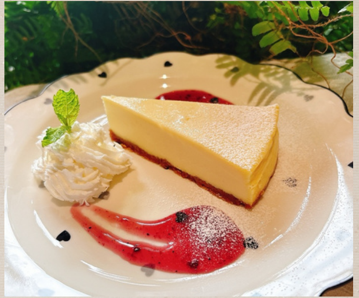
ニューヨークチーズケーキ ¥1000