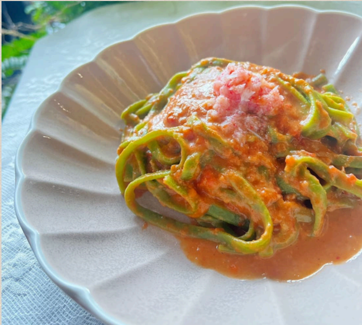
ほうれん草フェットチーネを使用した蟹のクリームパスタ ¥1400