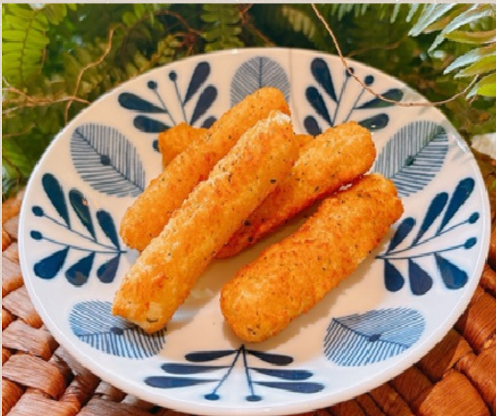
モッツアレラチーズ スティック ¥600