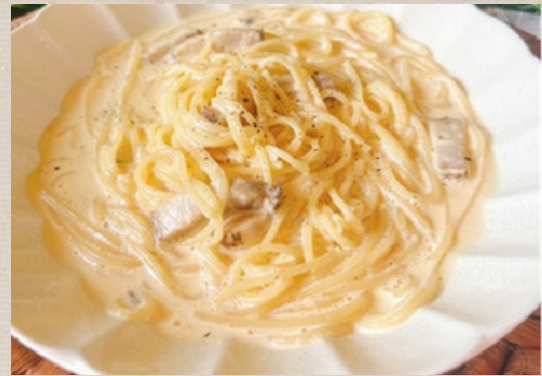
燻製ベーコンのカルボナーラ