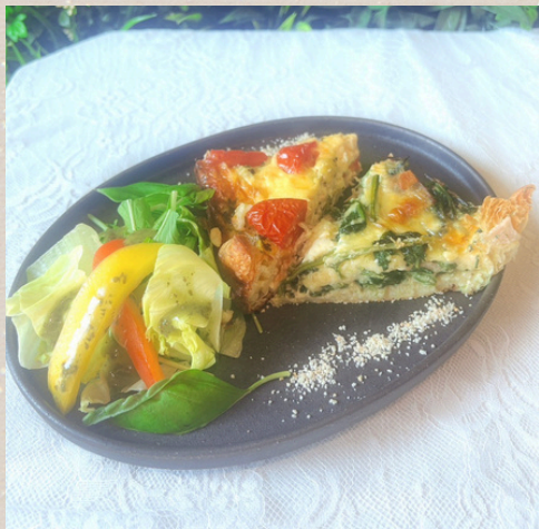
キッシュランチセット

+300円サラダ小鉢・+300円アイスクリーム・+350円コーヒーゼリー・+500円ミニシュガークレープ ドリンクはタンブラー交換制になります。空になりましたら呼び出しボタンをご利用ください