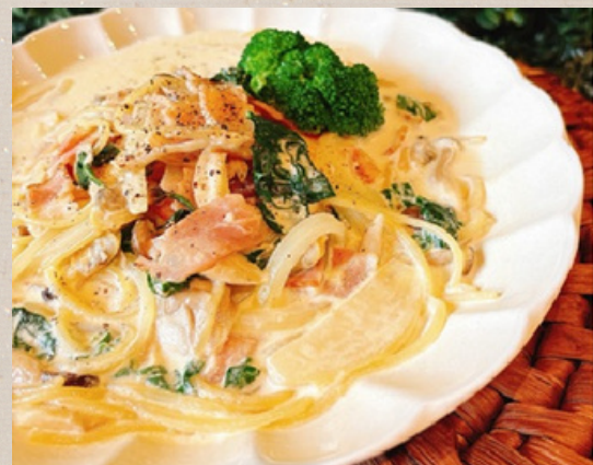
10食限定 ブロッコリーとシーフード のクリームパスタ