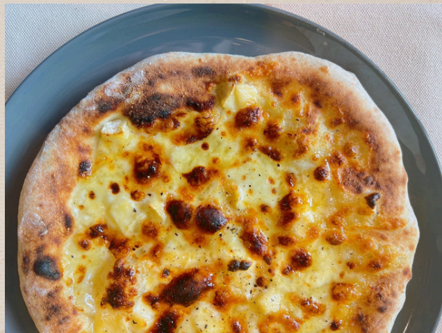
クアトロフォルマッジオ

(モッツアレラ・ナチュラルチーズ・クリームチーズ・ パルメジャーノレッジャーノ)