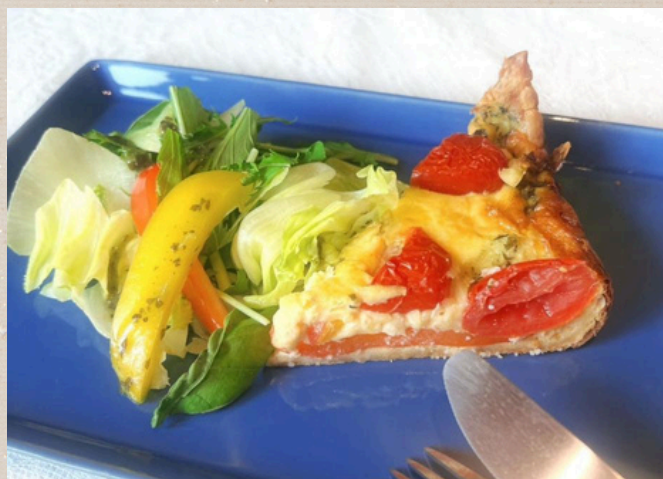
モーニングキッシュプレートセット