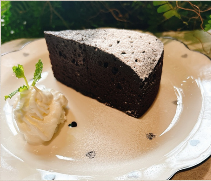
ガトーショコラ ¥950 (生クリームとコーヒークリーム)